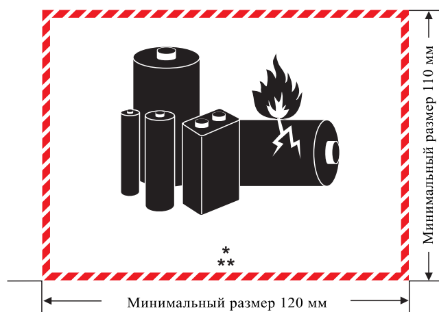
Маркировочный знак литиевых батарей